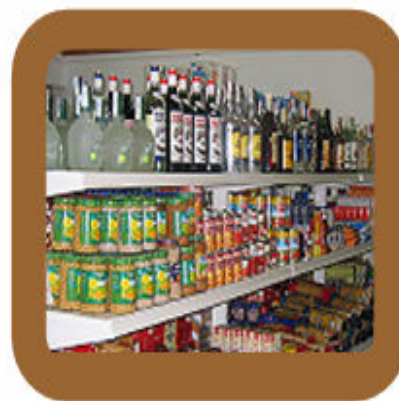
Edwin Escalante Ramos