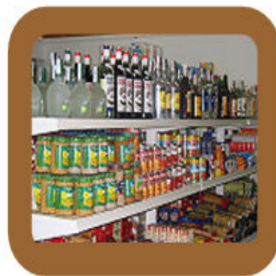
Edwin Escalante Ramos